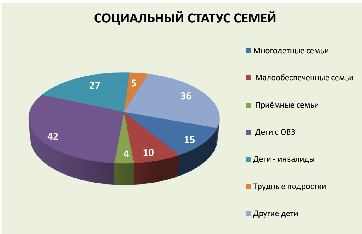
Сравнительный анализ социального статуса посетителей СПП за 4 года